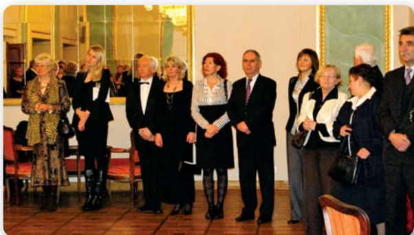
Absolwenci na spotkaniu noworocznym