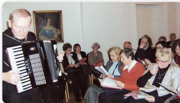
Śpiewaliśmy pod niebiosy

„Stawiliśmy się na Placu Mickiewicza, aby pojechać w nieznane, a trafiliśmy na Plac Bernardyński” – żartował jeden z uczestników 50-osobowej grupy osób chętnych do śpiewania kołęd.